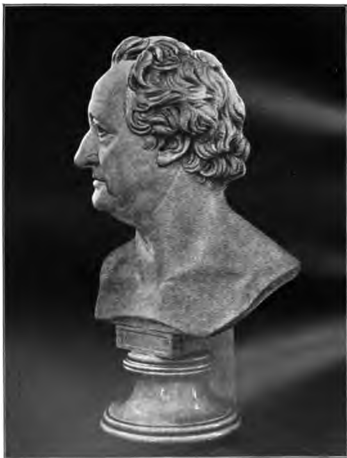
J. W. von Goethe Nach der Büste von Chr. D. Rauch (1820)